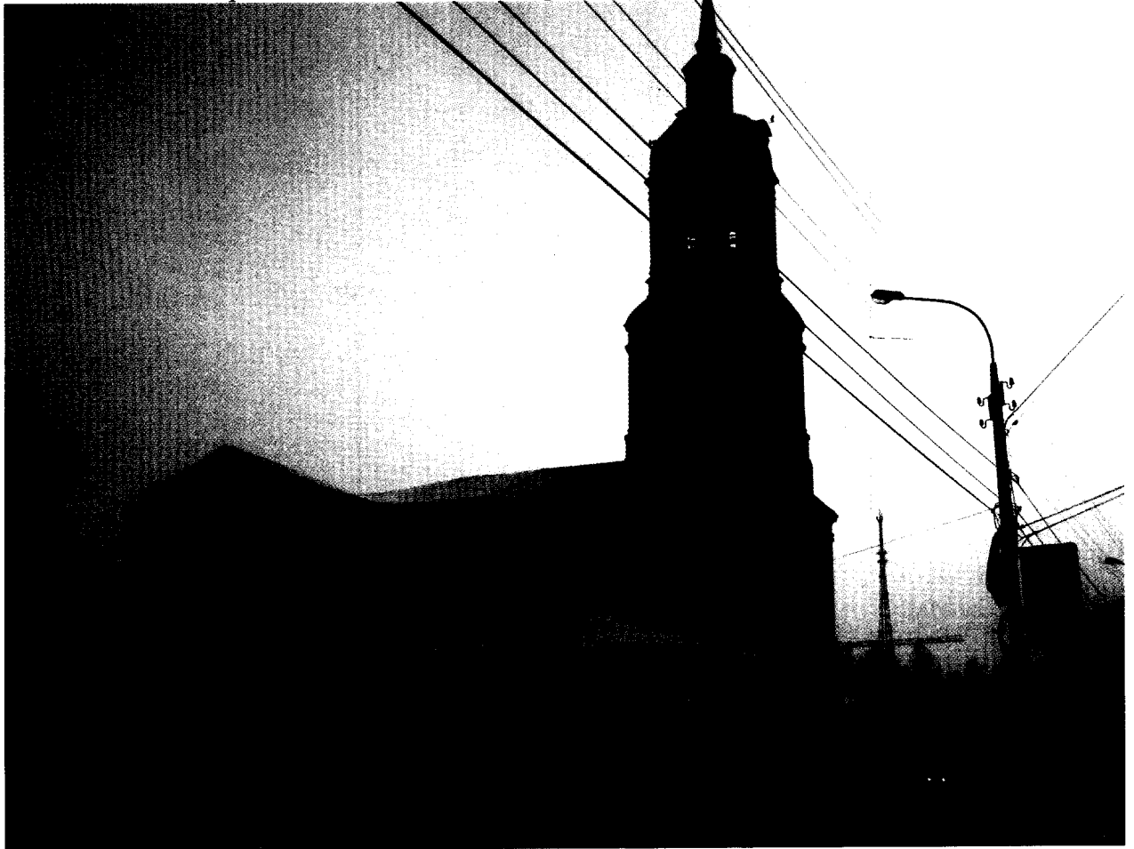
Фото 1. Общий вид с северо-запада на объект культурного наследия. дата съёмки – 18 декабря 2015 г. Кировская область, г. Киров, ул. Казанская, дом 50, «Спасский собор с двумя палатками на паперти, 1769 г.».