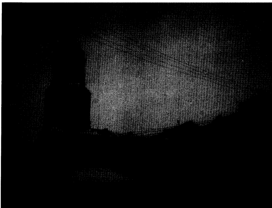
Фото 2. Общий вид с юго-запада на объект культурного наследия. дата съёмки – 18 декабря 2015 г. Кировская область, г. Киров, ул. Казанская, дом 50, «Спасский собор с двумя палатками на паперти, 1769 г.».