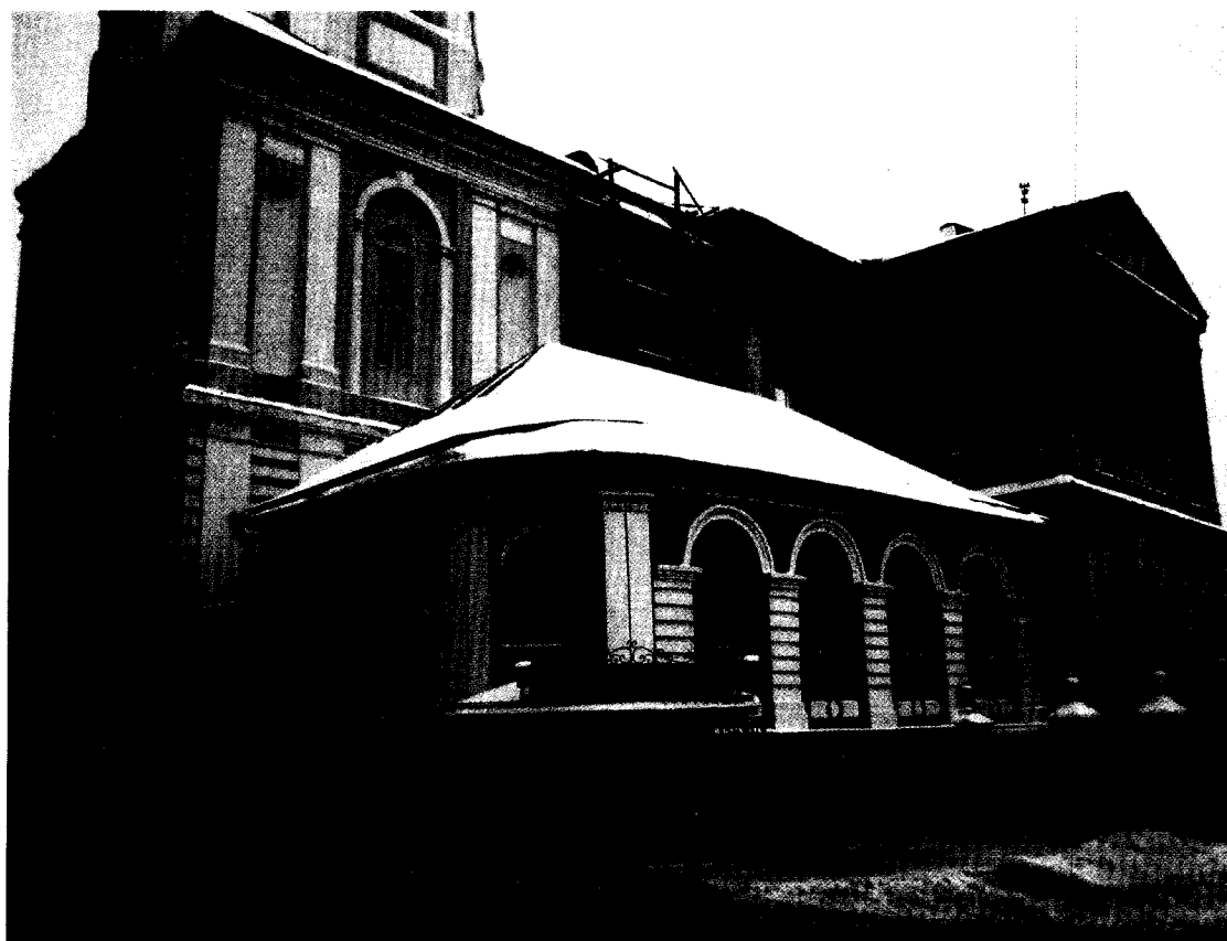
Фото 3. Вид с юго-запада на объект культурного наследия. дата съёмки – 18 декабря 2015 г. Кировская область, г. Киров, ул. Казанская, дом 50, «Спасский собор с двумя палатками на паперти, 1769 г.».